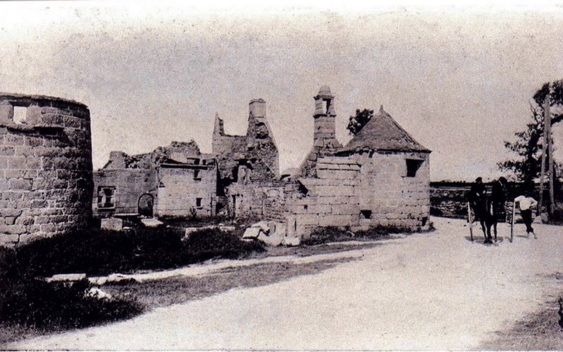
Ancien Manoir de Brignogan.