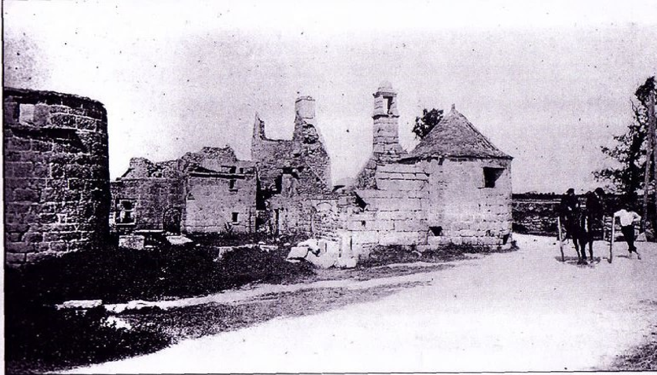
Le manoir de Skluz, situé à l'angle sud-ouest de la baie de Pontusval, sur la route du Phare, date du début du XVII e siècle. Il est habité en 1617 par Jean du Bois, seigneur du Skluz. Claude du Bois (sans doute petite-fille de Jean) l'apporte à la famille du Poulpry, seigneur de Kerilla. Abandonné depuis la Révolution de 1789, le manoir est en ruines lorsque cette photo est prise vers 1880.