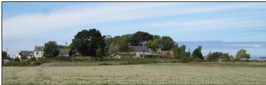
La butte de Cleguer, qui culmine à 34 m d'altitude.

Une ancienne carrière située au coeur du hameau du Cléguer, sur la commune de Plounéour-Brignogan-Plages, à l'Est de l'antenne de télécommunication de Kerlouan, a servi pour la construction de l'église de Brignogan. Ceci a été confirmé par une habitante du hameau.