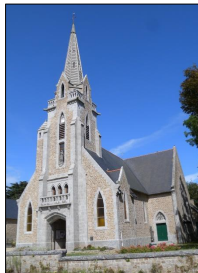
L'église Sainte Bernadette, Brignogan, avec son granite du Huelgoat gris clair et ses murs en leucogranite de Saint-Sauveur ocre, à grain fin.

Louis CHAURIS (2014) explique : « (...) Brignogan a été érigé en paroisse en 1935 [entraînant] en 1938-1939, la construction d'une église (...) ; la flèche du clocher remonte seulement à 1962 » .