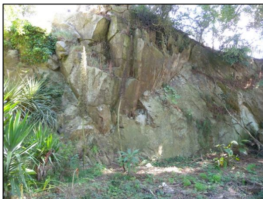
L'ancienne carrière, au milieu des propriétés privées. Dimensions approximatives : 20-25 m de long X 15-20 m de large X 5 m de hauteur de front de taille visible.