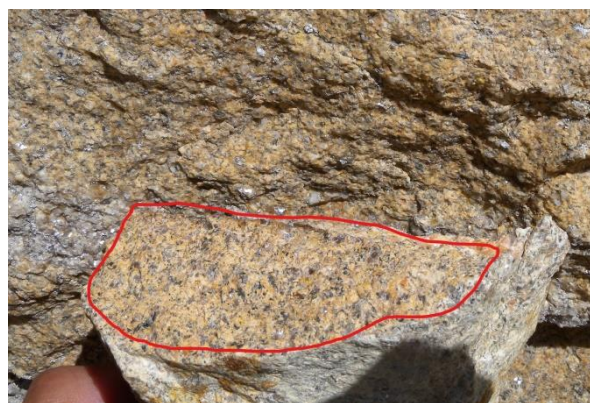
Un échantillon du granite de la carrière (entouré en rouge) apposé contre les moellons de l'église montre que le granite a la même origine et qu'il s'agit de leuco-granite de Saint-Sauveur ocre, à grain fin.