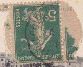
BRIGNOGAN (Finistère). — La Plage, vue sur Poul-ar-C'has