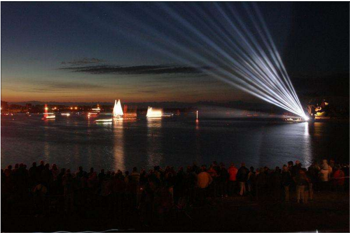
Festival Lumières en Baie.